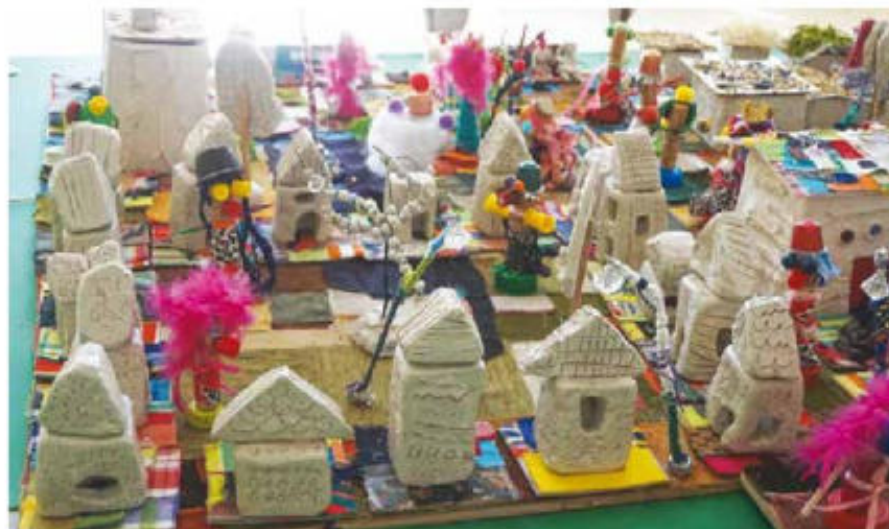
Village créé par les enfants de la maternelle de Noyarey

Une fois n'est pas coutume, la fête des écoles avait lieu cette année le 27 juin, un samedi, au lieu des traditionnels vendredis soirs habituels. Une décision prise par l'équipe du Sou des Ecoles et l'ensemble des enseignants, afin de rassembler plus de Nucérétais autour de cette manifestation ouverte à tous. Au programme : des spectacles bien sûr, suivis de la kermesse, du tournoi de foot et d'une grande chasse au trésor, une nouveauté qui a remporté un