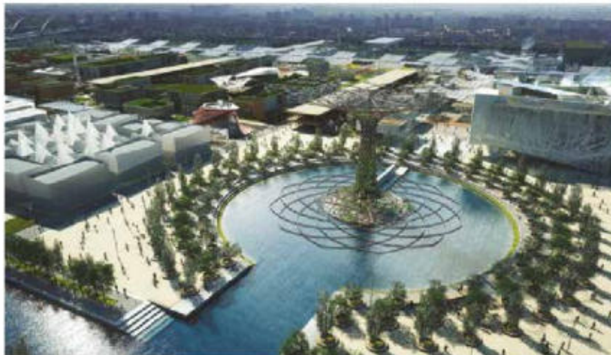
L'exposition universelle de Milan (maquette)

Le jumelage avec la commune italienne de Merone écrit un nouveau chapitre avec un grand week-end italien. Un bus prendra le départ le vendredi 4 septembre 2015 en fin de journée pour nous permettre :