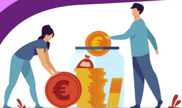
Comparatif coût engagement / valeur de revente estimée (Uniquement pour les biens évalués par l'EPFL)