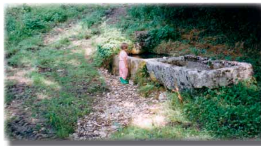
Ezy, fontaine b