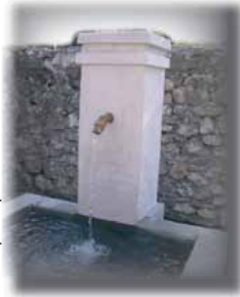
Rue du 19 mars

Les fontaines les plus anciennes du vieux village remonteraient au début du XIX e siècle ; en effet la commune possède un cadastre daté de 1839 où un certain nombre d'entre elles figurent déjà. Elles ont pour la plupart un bassin en pierre. Les bassins en béton correspondent à un groupe de fontaines commandé par la commune à un entrepreneur entre 1900 et 1910.