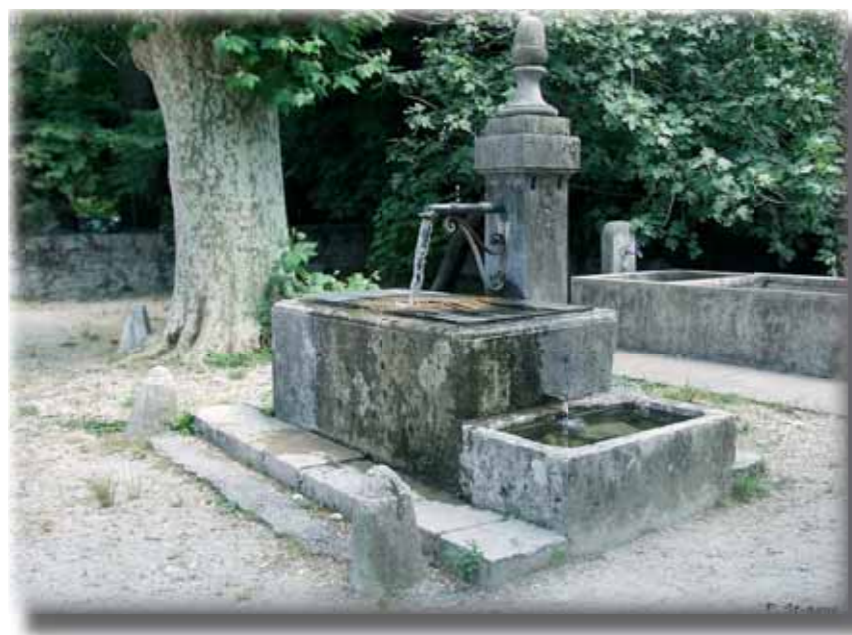
Clairfontaine n° 14