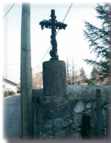
Croix rue du Moulin

Vous passez dans un virage près d'une statue ancienne de la Vierge (h). Arrivé en haut du hameau, vous pourrez laisser votre voiture au bord d'un croisement de chemins, juste après le hameau, et commencer le circuit des 7 fontaines d'Ezy. Si vous souhaitez vous y désaltérer, il est préférable de demander l'autorisation des propriétaires.