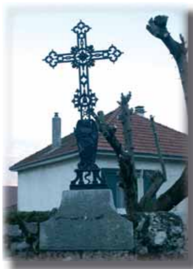
Croix rue des Noyers

Remontez le chemin et reprenez sur votre gauche, pour arriver à La Poste. Tournez la rue à gauche: dans le parc dans le jardin de Merone