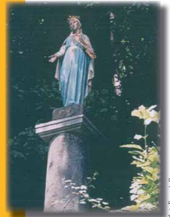
La Vierge d'Ezy