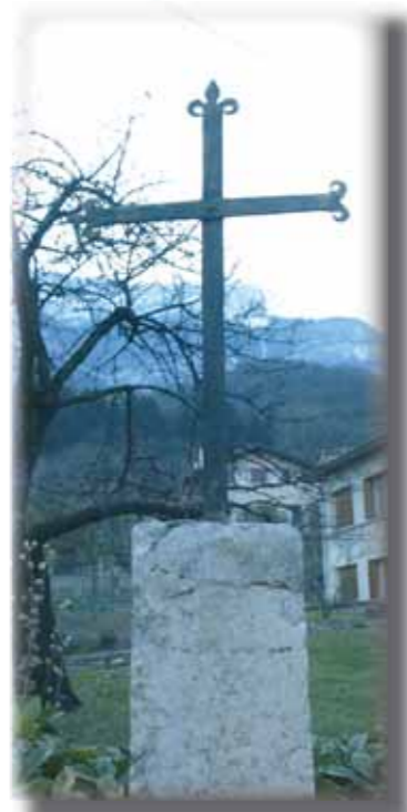
Croix du Paillet

A droite, part un chemin, la fontaine n° 3 se trouve juste au bord. Faites alors demi-tour, repassez devant l'impasse avec la petite croix . En face de vous un bâtiment qui était l' ancienne Mairie-école , avec à l'entrée la fontaine n° 4.