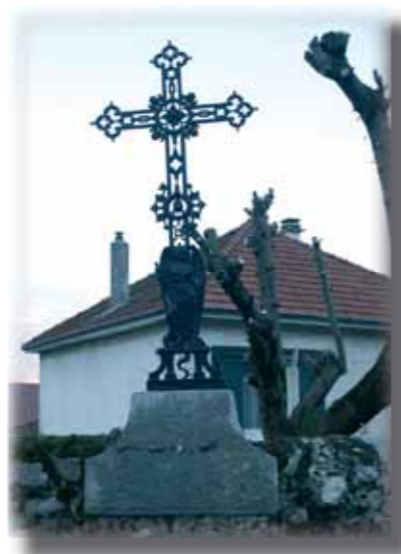
Croix rue des Noyers

Remontez le chemin et reprenez sur votre gauche, pour arriver à La Poste. Tournez la rue à gauche: dans le parc dans le jardin de Merone