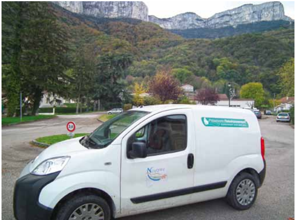
La commune de Noyarey dispose aujourd'hui d'un parc de trois véhicules GNV. En photo, la voiture des services techniques ; les deux autres étant à la disposition de la police municipale et du service de portage des repas.

Les véhicules légers fonctionnant au GNV sont des véhicules essence, avec une motorisation du type bicarburation. Le gaz est stocké avec une pression de 200 bars dans des bouteilles intégrées au châssis, avec un détendeur, et une carte d'injection dédiée au GNV. L'allumage se fait à l'essence, pendant 2 à 5 secondes, et bascule sur le GNV. Si le réservoir de gaz est vide, la bascule se fait automatiquement vers l'essence. L'autonomie est variable selon la taille et le modèle des véhicules (Ex Fiat Punto : moyenne 250