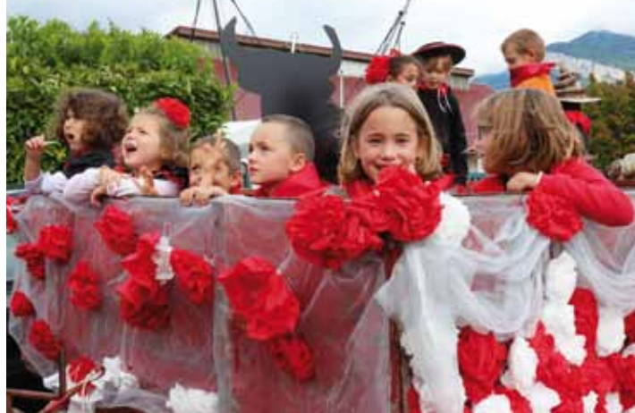
COMITÉ DES FÊTES