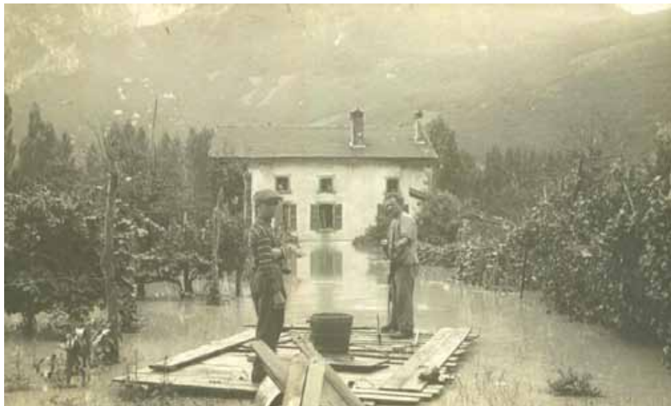
Les inondations restèrent fréquentes malgré les endiguements jusqu'au début du 20 e siècle. Ici (et ci-dessous) celle de 1928 qui fut particulièrement dévastatrice.

Quand on consulte un plan de Noyarey et que l'on part à la découverte des différents chemins qui traversent le village, trois voies transversales reliant les flancs du Vercors à la rivière attirent l'attention : au nord, le chemin de l'Île Cordée (1) , frontière avec Veurey, au centre, la route de la Vanne, au sud, le chemin de Pra-Paris, presque en limite de Sassenage et doublé par la RD105F. Parallèles et tracés au cordeau, ils ne manquent pas de surprendre !