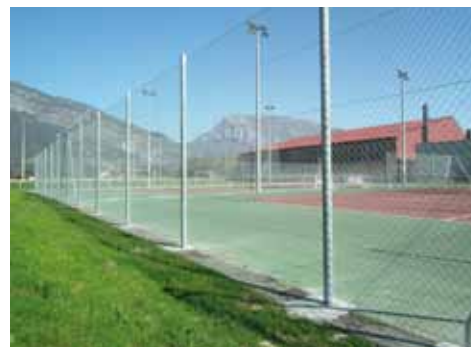
La clôture des courts de tennis a été entièrement refaite

La clôture du terrain de tennis vient d'être posée (20 000 €) ; des travaux entrepris à la suite d'une dégradation du grillage. La réfection du terrain stabilisé de football (70 000 €) est programmée ainsi que le désenfumage, l'éclairage extérieur et divers aménagements au gymnase pour 23 000 €.