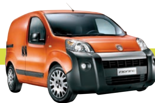
Deux véhicules GNV, un Fiat Fiorino et un Citroën Berlingo, destinés aux services techniques et au portage des repas à domicile seront mis en service pendant l'été.

moteurs GNV produisent surtout moins de particules, ces substances particulièrement nocives pour la santé, rejetées notamment par les diesels. De plus, le GNV est une énergie propre sur toute la chaîne, de la production à la distribution. Les véhicules GNV sont en fait des véhicules hybrides équipés d'un réservoir gaz de 84 litres permettant de parcourir en moyenne 300 km et d'un réservoir essence utilisé pour le démarrage. Mais les stations gaz ne sont pas très nombreuses : la seule qui existe dans l'agglomération est située devant GEG à proximité du CEA. C'est pourquoi une micro-station sera implantée sur le site des