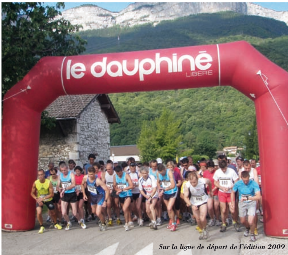
Sur la ligne de départ de l'édition 2009

Renseignements et inscriptions auprès de Christian Berthier au 04 76 53 97 81 ; courriel : christian.berthier532@orange.fr